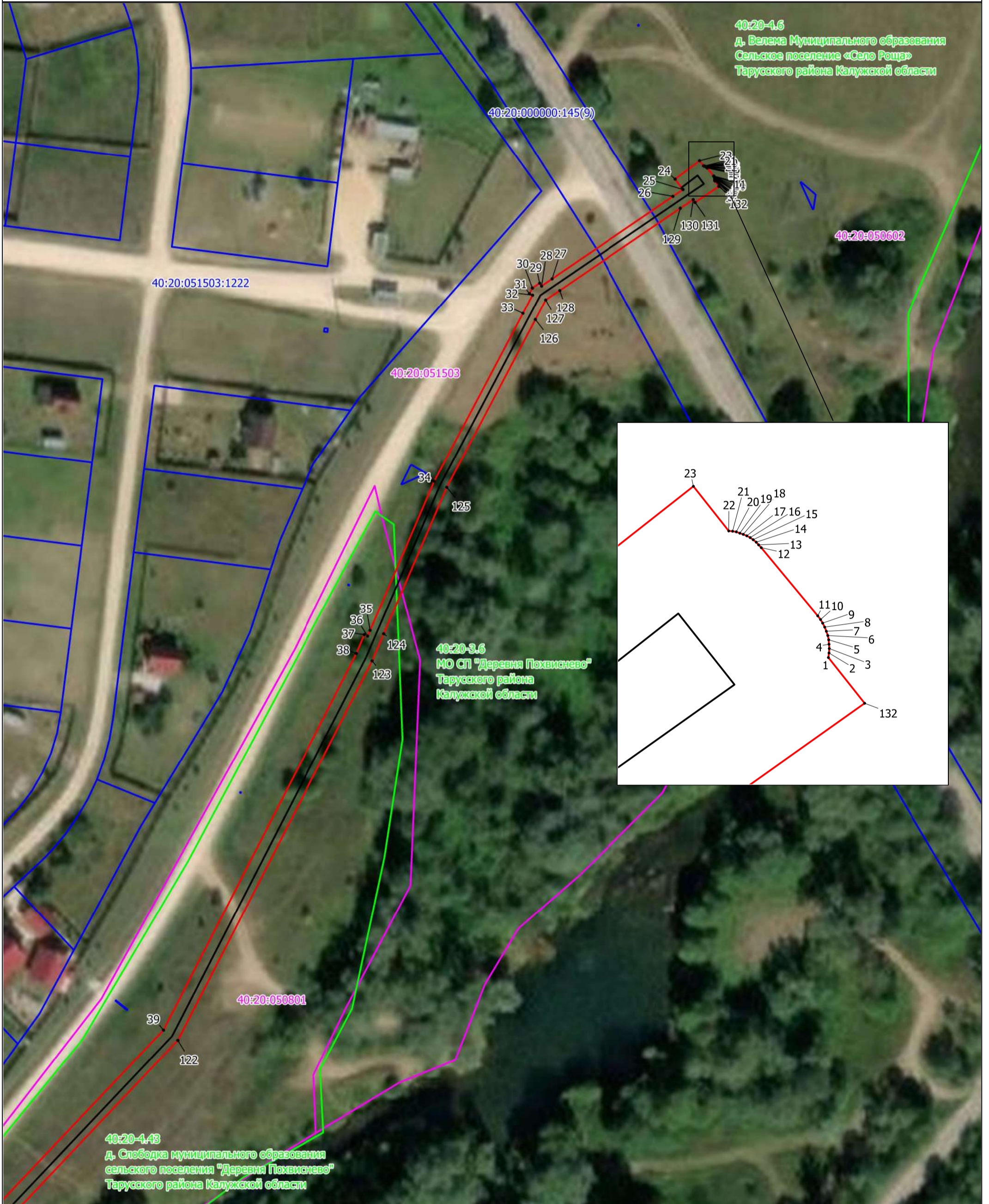
Схема расположения границ публичного сервитута Выноски №1